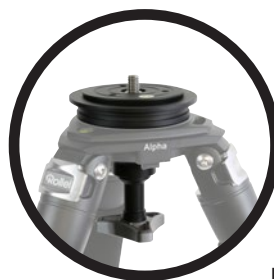
Bowl Adapter G-75 Ideal zum Ausbalancieren von 3D-Köpfen, Gimbals, Panorama- und Videoköpfen. Nicht im Lieferumfang enthalten (Art.-Nr. 22600).