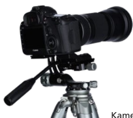
Kamera nicht im Lieferumfang enthalten.