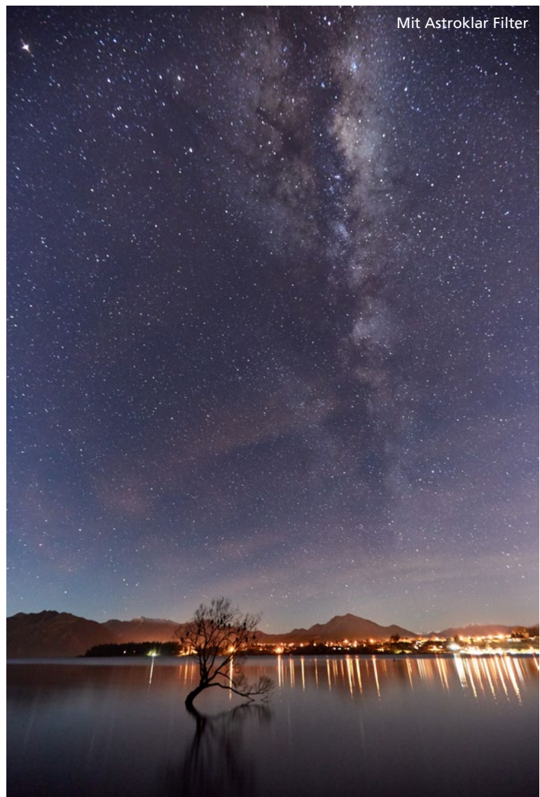
Mit Astroklar Filter

Das Phänomen der Lichtverschmutzung, das auch als Lichtsmog bezeichnet wird, entsteht durch die Aufhellung des Nachthimmels, was in der Regel durch künstliche Lichtquellen erfolgt, weil deren Licht in die Atmosphäre gestreut wird. Eben diese Lichtverschmutzung hat einen störenden Einfluss auf die astronomische Fotografie und auf Landschaftsaufnahmen sowie Stadtaufnahmen bei Nacht.