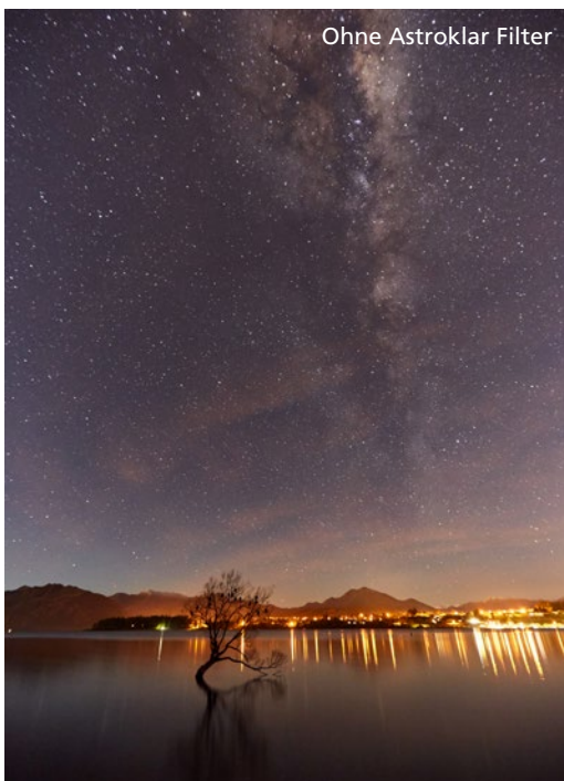
Ohne Astroklar Filter

Der Rollei Astroklar Filter, gefertigt aus hochwertigem optischen Glas, eignet sich besonders für die Astrofotografie und für Landschaftsaufnahmen bei Nacht. Dabei reduziert der Astroklar Filter effektiv die Lichtverschmutzung bei Aufnahmen in der Dunkelheit.