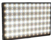
Tabletop Stand nicht im Lieferumfang enthalten.