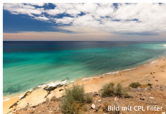
Bild mit CPL Filter