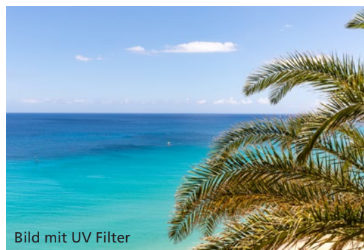
Bild mit UV Filter