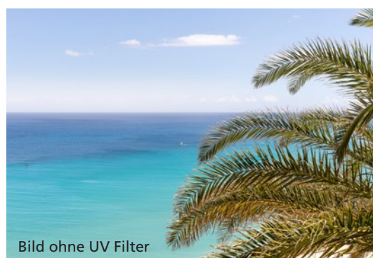
Bild ohne UV Filter