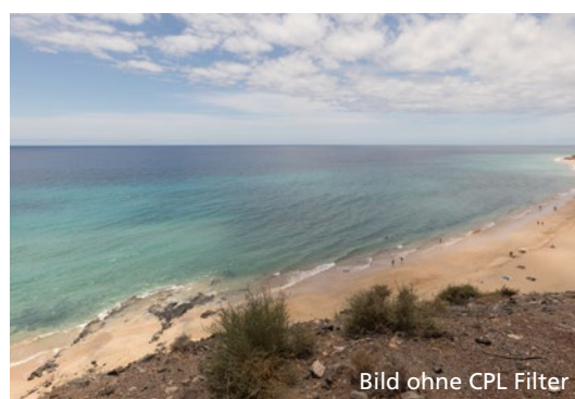
Bild ohne CPL Filter