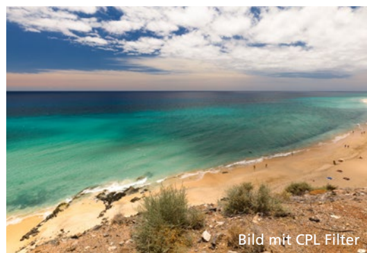
Bild mit CPL Filter