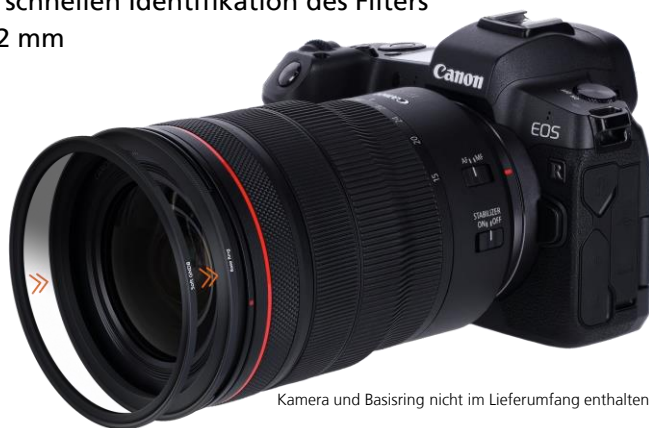
Kamera und Basiring nicht im Lieferumfang enthalten.