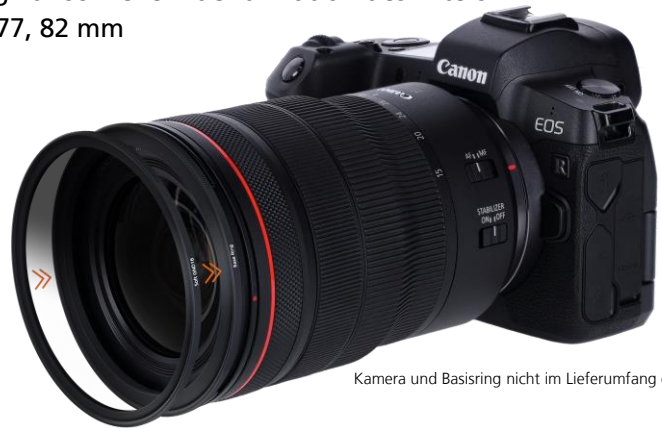
Kamera und Basiring nicht im Lieferumfang enthalten.