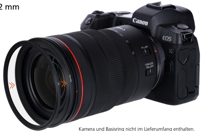
Kamera und Basisring nicht im Lieferumfang enthalten.