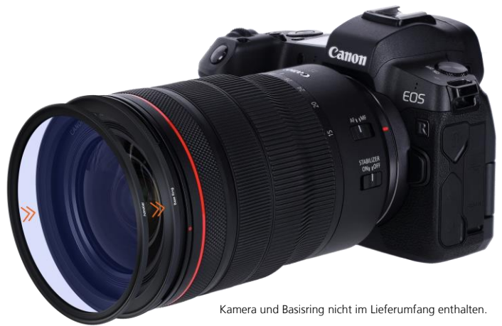
Kamera und Basiring nicht im Lieferumfang enthalten.