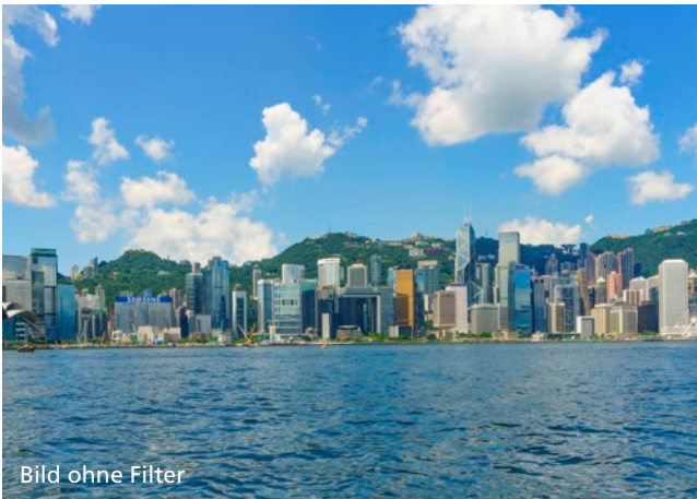
Bild ohne Filter