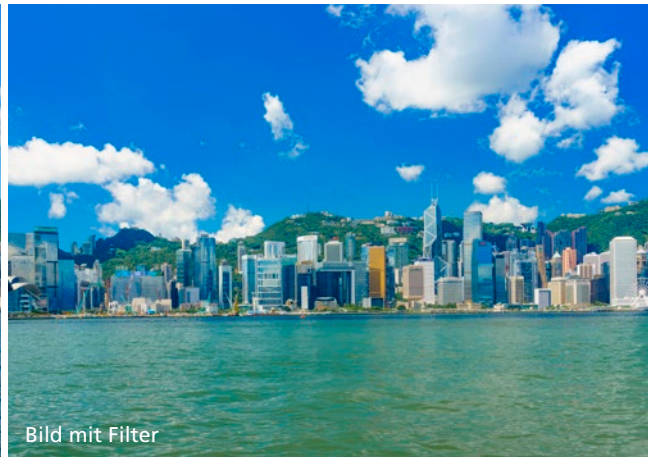
Bild mit Filter